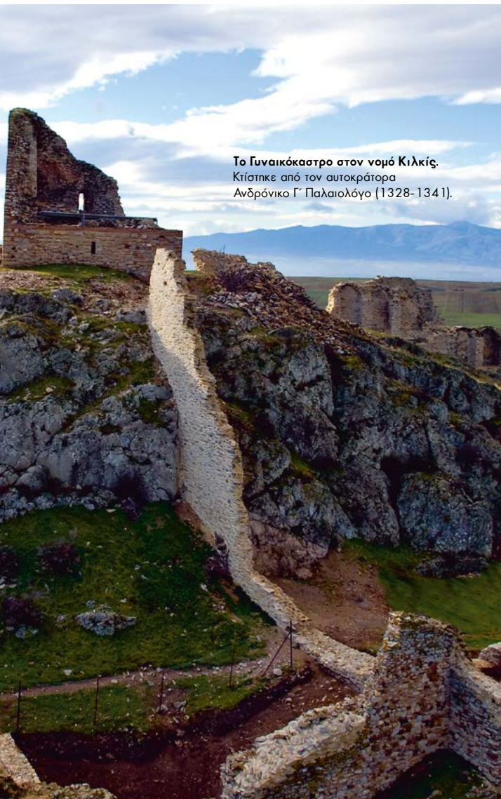
Το Γυναικόκαστρο στον νομό Κιλκίς. Κτίστηκε από τον αυτοκράτορα Ανδρόνικο Γ' Παλαιολόγο (1328-1341).

Στην έκθεση παρουσιάζονται το αμυντικό σύστημα της βυζαντινής αυτοκρατορίας, η οργάνωση της πόλης-κάστρου και η καθημερινή ζωή και παραγωγή μέσα και έξω από αυτό. Το αρχαιολογικό υλικό προέρχεται από την Κεντρική Μακεδονία και, κυρίως, από τη Ρεντίνα και το Γυναικόκαστρο. Η θεματική ενότητα συμπληρώνεται από βίντεο-εγκατάσταση, η οποία ενημερώνει τον επισκέπτη και για τα κάστρα της Μακεδονίας και της Θράκης.